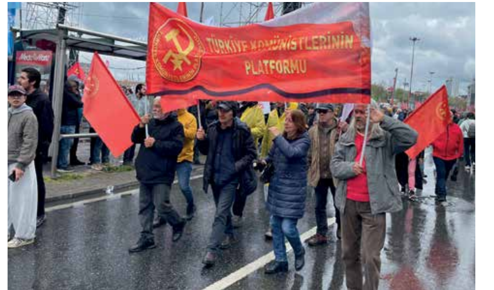
Kadıköy / İSTANBUL