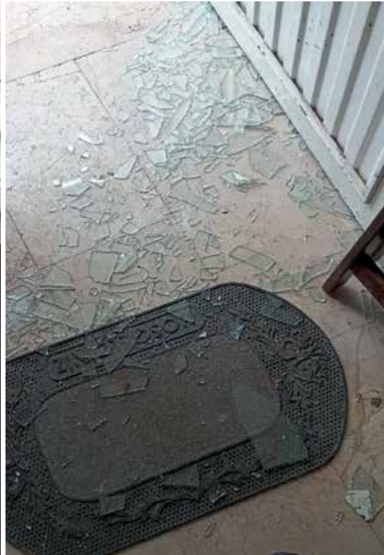
Kapıyı koçbaşı ile kırdıktan sonra ayrılırken hırsız (!) girmesin diye plastik kelepçelerle kapatmışlar.

Kendi öz ve kısıtlı gelirleriyle çalışmalarını yürüten vakfımıza çok ciddi