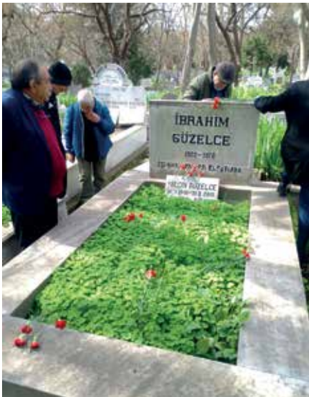
14 Nisan 2026 günü Güzelce ve Türkler’i andık.